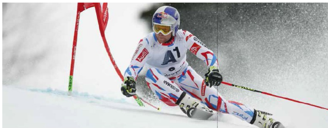
Alexis PINTURAUULT SKI ALPIN – Géant – Slalom – Super G – Super combiné Descente – Parallèle

Médaillé de bronze en géant aux JO de Sotchi (RUS) en 2014