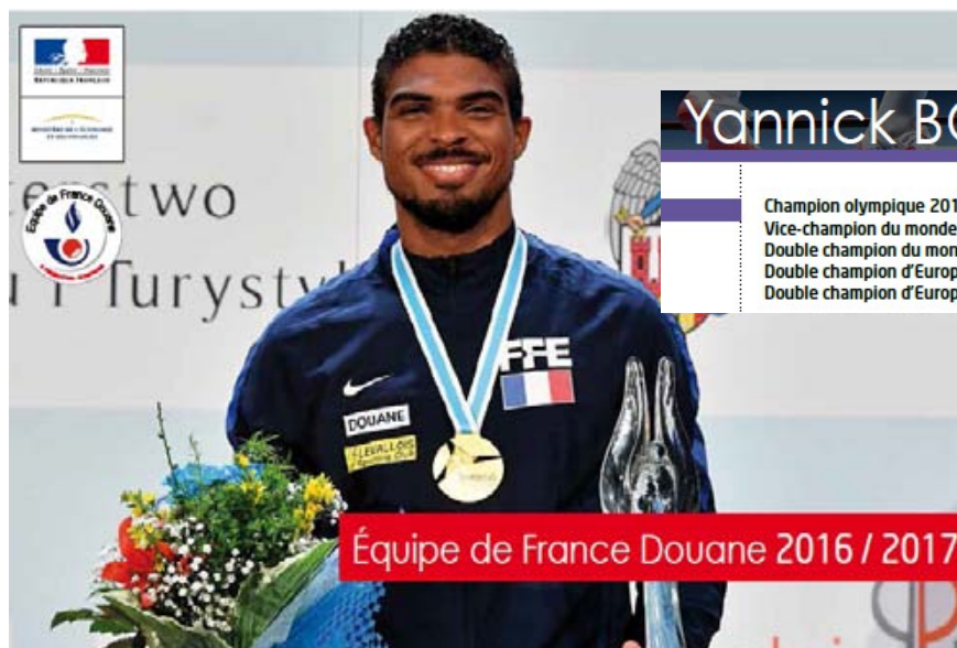
Yannick BOREL ESCRIME – Epée

Champion olympique 2016 par équipe à Rio (BRA) Vice-champion du monde 2012 par équipe à Kiev (UKR) Double champion du monde universitaire 2013 / 2015 par équipe à Kazan (RUS) Double champion d'Europe 2016 individuel et par équipe à Torun (POL) Double champion d'Europe des Clubs 2014 / 2015 par équipe à Heidenheim (GER)